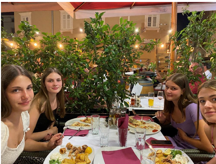
Slika 9 Večerja v mestu

Na plaži smo ostale do večernih ur in si ogledale še prečudovit sončni zahod. Z veseljem bi vse ostale dlje, a smo se zaradi večernih – ali naj rečem raje nočnih – načrtov morale vrniti v apartma. Ponovile smo postopek s tuširanjem, večerje pa si nismo pripravile same, saj smo na večerjo odšle v mesto. Nekatere prijateljice so si privoščile kalamare, nekatere pa smo ostale pri »klasiki« in si naročile pico.