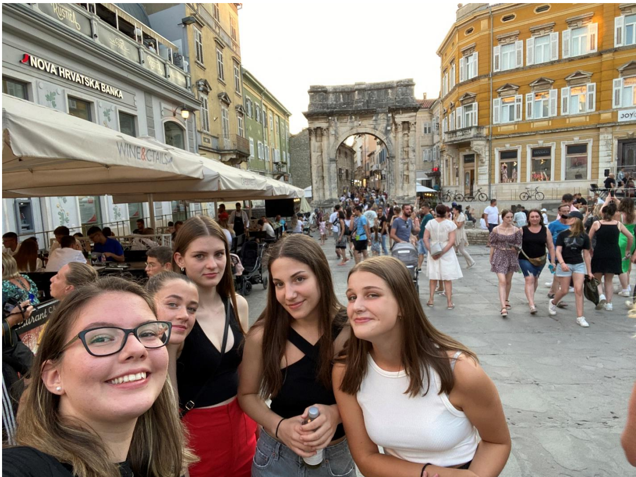
Slika 4 Avtorica s prijateljicami v Puli, v ozadju je Slavolok Sergijevcev (Zlata vrata)

Že na prvem obhodu po mestu smo lahko občudovala nekatere antične ostanke. Prvi na naši poti je bil Slavolok Sergijevcev, imenovan tudi Zlata vrata. Zgrajena so bila nekje med letoma 29 in 27 pr. n. št., postavila pa jih je družina Sergijev, v čast trem članom družine, ki so opravljali visoke uradniške dolžnosti. Slavolok se je naslanjal ob mestna vrata Porta Aurea (Zlata vrata), ime pa izhaja bodisi iz bogato okrašenega loka bodisi iz pozlate na vratih. Vrata in mestno obzidje sta bila porušena na začetku 19. stoletja v času urbanizacije in širitve mesta izven obzidja. Dandanes na majhnem trgu ob slavoloku potekajo številne kulturne prireditve, v bližnji ulici pa so številne prodajalne.