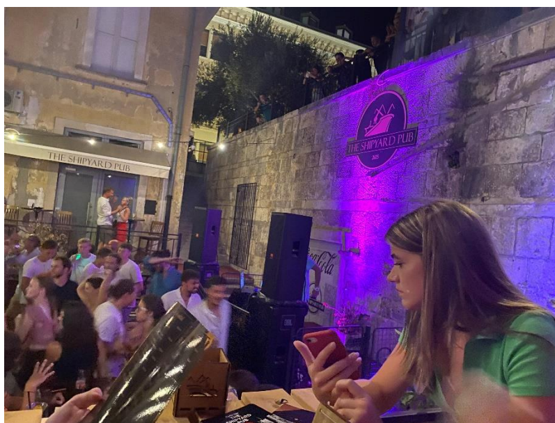
Slika 10 "The Shipyard Pub"

Najprej smo si privoščile koktejl, nato pa smo se pridružile ostalim na plesišču.