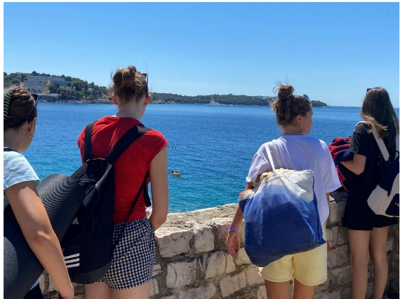
Slika 5 Morje. Končno.

Drugi dan našega potovanja se je začel nekoliko kasneje kot pričakovano, saj smo se zbudile šele okoli 9. ure. Najprej smo pozajtrkovale in popile jutranjo kavico, se »uštimala« in pripravile stvari, nato pa se – seveda v največji vročini – odpravile proti plaži. Ker je bil naš apartma bližje centru mesta kot morju, smo se do izbrane plaže, ki jih je sicer v okolici Pule res veliko, odpeljale kar z mestnim avtobusom. Cena avtobusa je bila ugodna, saj je za vožnjo v eno smer vsaka odštela le 7 kun, oziroma 1 evro. Tako smo si prihranile kar 40 minut hoje.