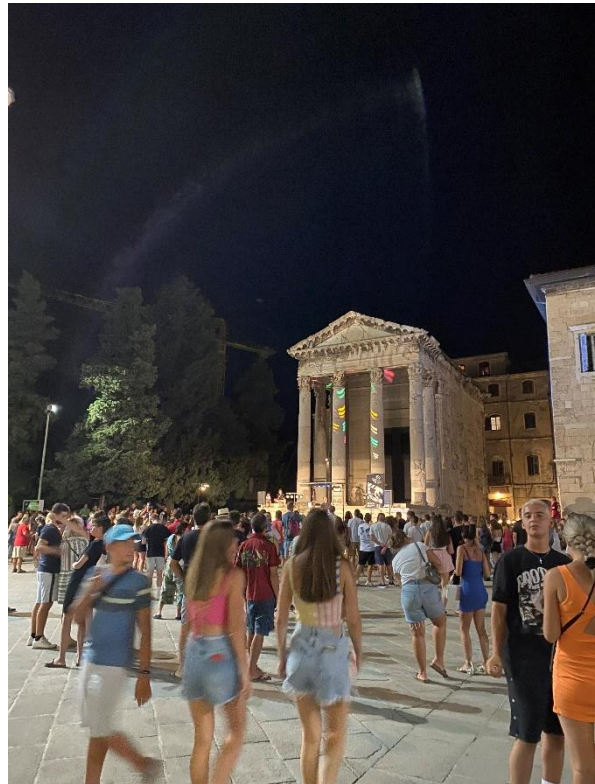
Slika 7 Avgustov hram

Še nekaj »obveznih« besed o Avgustovem hramu ... Gre za svetišče na forumu (trgu), ki je bilo posvečeno boginji Romi in cesarju Avgustu, zgrajeno pa je bilo med letoma 2 pr. n. št. in 14, ko je Avgust preminil. Po obliki ima tipično konstrukcijo svetišča, njegova funkcija pa se je skozi čas spreminjala; na koncu poganske antike se ga ni več uporabljalo kot svetišče, ampak kot cerkev, nato kot skladišče za žito, na začetku 19. stoletja pa je bil vanj postavljen muzej kamnitih spomenikov. Leta 1944 je bilo zaradi bombardiranja porušeno skoraj v celoti, njegova rekonstrukcija pa je potekala od leta 1945 do 1947. Danes se tam nahaja manjša razstava antičnih skulptur iz kamna in bronu.