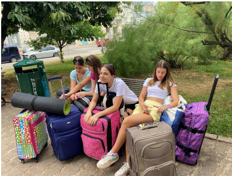
Slika 11 Čakanje na vlak

In prišel je. Zadnji dan. Vedele smo, da bo prišel hitro, a smo vseeno potihoma upale, da ga ne bo. Apartma smo morale zapustiti že v zgodnjih urah, do prvega vlaka pa smo nato morale čakati kar nekaj ur. Najprej smo se počasi odpravile proti železniški postaji, a se tokrat nismo s potovalkami sprehajale po centru mesta, temveč smo našle pot naokoli. Zopet smo se sprehodile tudi mimo pulske Arene. Ker imam rada rimsko zgodovino in čas gladiatorjev, me je zelo mikal ogled Arene, a žal ni bilo dovolj