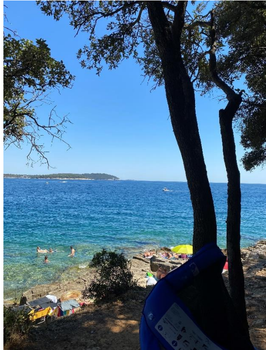
Slika 12 Spomin na lepe počitnice