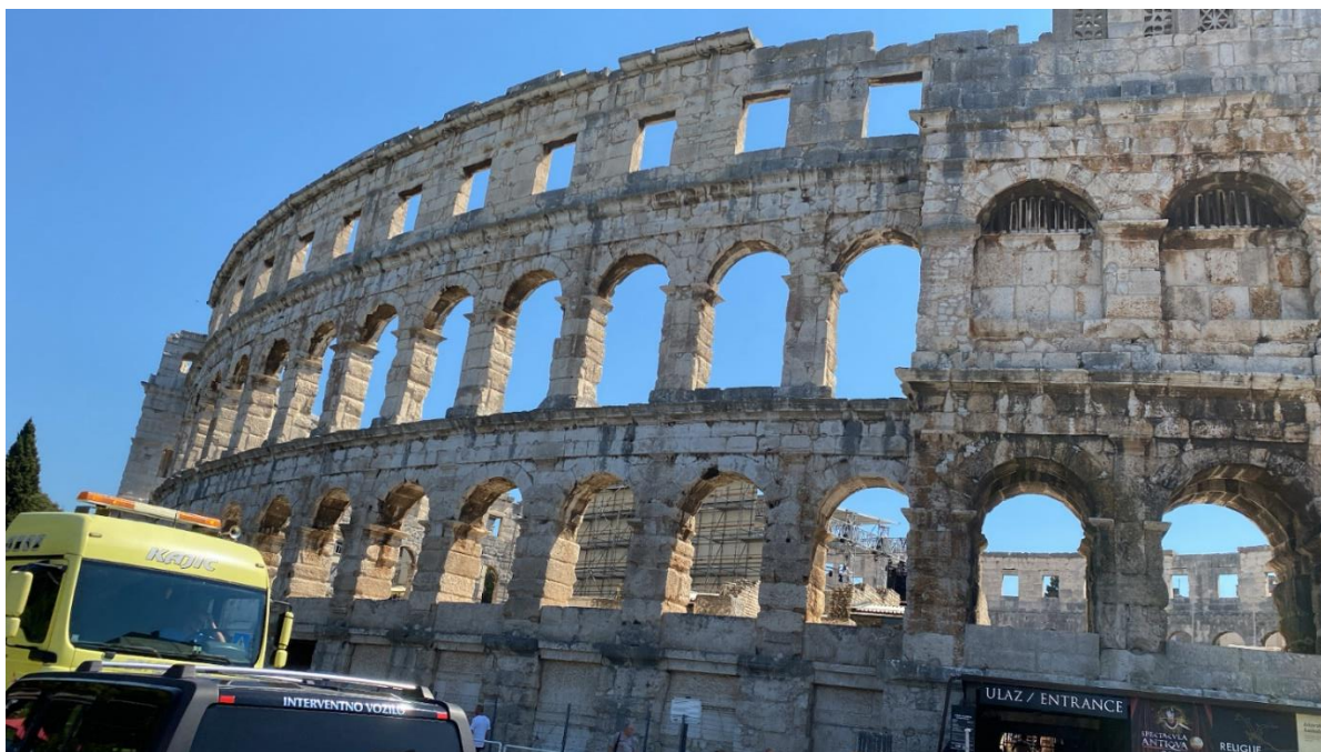
Slika 1 Puljska arena

Pisal se je 2. avgust in bil je topel poletni torek, ko smo se s prijateljicami odpravile na poletni oddih na sosednjo Hrvaško. Za počitniško destinacijo smo si izbrale Pulo, saj ima Slovenija do Pule dobro železniško povezavo, v Puli se zbira veliko mladih, obenem pa slovi tudi po nekaterih znamenitostih.