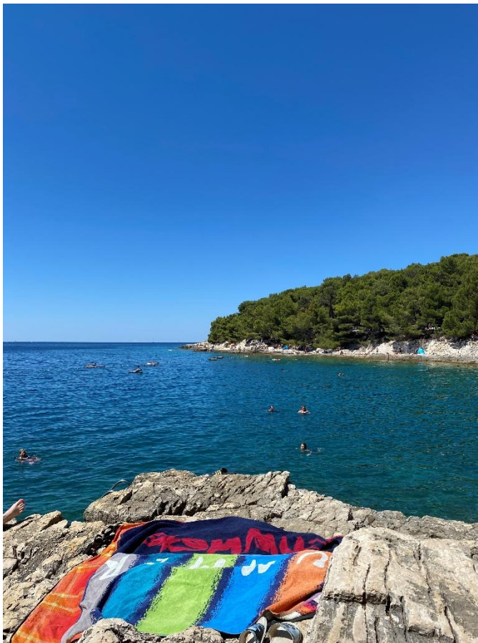
Slika 6 "Naša" plaža

Za prvo kopanje smo si izbrale plažo, nad katero nismo bile najbolj navdušene. Ko smo sestopile z avtobusa, smo bile presrečne, saj je avtobus ustavil poleg nakupovalnega centra, kjer smo si lahko nakupile nekaj sadja in prigrizkov za čez dan. Takoj ko smo do plaže prišle, pa je naše zadovoljstvo usahnilo. Dan je bil vroč, plaža betonska, pokazatelj napačnega izbora destinacije pa je bilo tudi pomanjkanje kopalcev.