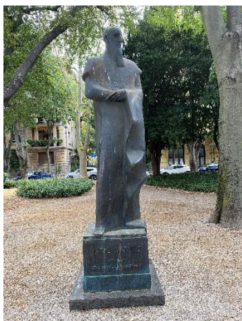
Slika 2 Spomenik Marku Maruliću

Ker smo iz različnih krajev, smo se najprej morale vse dobiti v istem kraju. Naša skupna pot se je začela v Divači, kjer smo se vkrcale na vlak. Po slabih štirih urah in približno 130 km dolgi poti smo se končno prispele do svojega cilja. Vožnja je bila dolga in naporna, a v dobri družbi je vse lažje. V Pulo smo prispele v času kosila, za katerega žal še ni bilo časa. Izmučene od naporene vožnje smo se z vso prtljago in po samem središču mesta peš podale do apartmaja. Na poti smo videle kip, postavljen v čast Marka Marulića, očeta hrvaške književnosti. Videle smo tudi puljsko Arenu, nekaj parkov, predvsem pa veliko turistov. Kljub temu smo bile edine, ki smo se po mestu sprehajale s