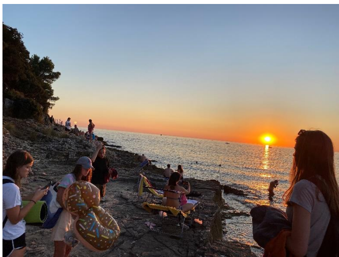
Slika 8 Sončni zahod na plaži Verudela

Če smo morda mislile, da odhoda na plažo ne moremo še bolj zamakniti kot prejšnji dan, smo se pošteno zmotile. Nov dan se je začel ne ob 9., ne ob 10., temveč šele med 11. in 12. uro. Zaradi tako poznega »jutra« smo se odločile za kasnejši odhod na plažo, prej pa smo si skuhale še kosilo.