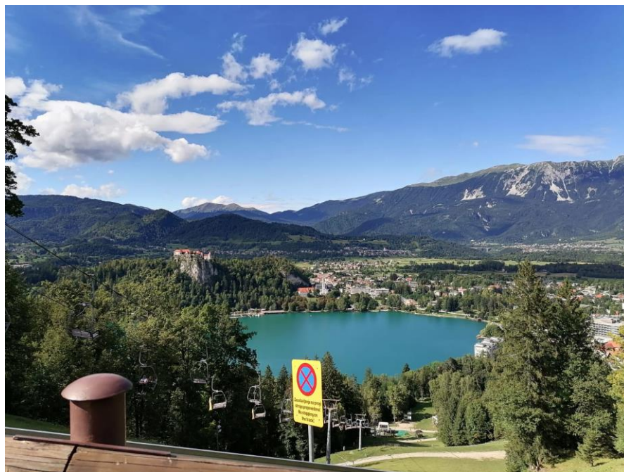
Slika 6 Pogled na Blejsko jezero s Straže

Po kosilu in pocitku smo se odpravili na Bled, in sicer na poletno sankališče Straža. To je sankališče, kjer se pripet v sanke spuščáš po železni progi. Proga je dolga 520 metrov in je speljana vzdolž hriba Straža nad Blejskim jezerom. Pri spustu lahko dosežeš tudi hitrost 40 km/h! Bila sem najbolj strahopetna, saj sem šla res zelo počasi in neprestano sem zavirala. Med prvo vožnjo sem celo hlipala, da je to preveč adrenalina zame. Preostali so v poletnem sankanju uživali in divjali, kot da jim gre za življenje. Tudi babi. Ko je bilo