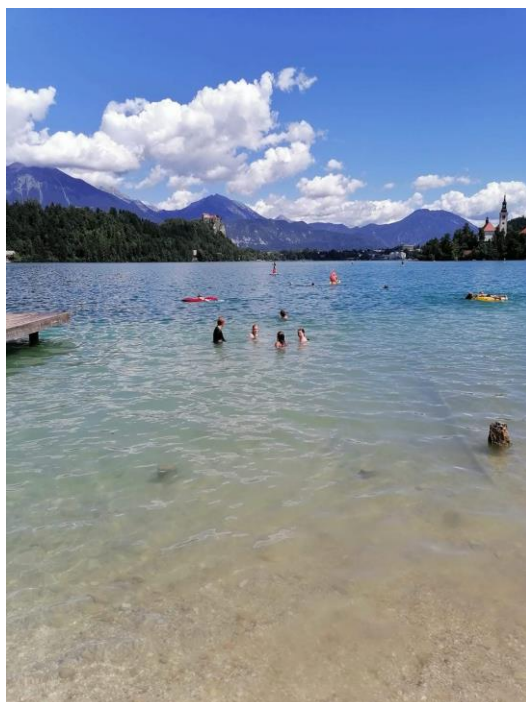
Slika 9 Kopanje v Blejskem jezeru

Zadnji dan nismo imeli v načrtu nobenih večjih podvigov. Ko sta nas babi in Breda nahranili, smo šli plavat v Blejsko jezero. Plaža je bila polna ljudi in ker je bil namen naših počitnic, da se od njih odmaknemo, smo se po dobrih dveh urah vrnili h kočī in tam preživeli preostanek časa z igranjem