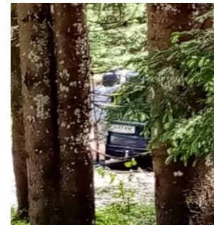
Slika 5 Brat od sreče objema avto

Nismo se držali nobene pešpoti, ampak smo malo improvizirali. Avto smo parkirali nekje v gozdu pred Rupami, daleč od prave učne poti. Naša improvizacija se je poznala po tem, da smo namesto 45 minut hodili več kot dve uri. Ko smo se začeli vzpenjati, smo bili zelo hitro na vrhu. Dan je bil oblačen in mrzel. Na klopici ob Blejski koči, tradicionalni planinski koči, smo popili topel čaj. Ko smo si odpočili, smo se odpravili nazaj v dolino. Med vračanjem smo bili že zelo utrujeni, zato se je zdelo, kot da pot nima konca. Zabavno je bilo opazovati mojega brata, ki je ob pogledu na naš avto kar stekel in ga začel objemati.