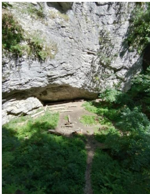
Slika 8 Pokljuška soteska

med umikanjem ledenikov Ob koncu naše pokljuške avanture sta k nam prišli še babini sosedi, Breda in njena hči Vita, ki sta nas leto prej gostili na Koroškem. Četrty dan smo se skupaj odpravili na ogled Pokljuške soteske. Pokljuška soteska je skoraj dva kilometra dolga soteska, ki je nastala v času zadnje ledene dobe, ko se je nekdanji tok reke med umikanjem ledenikov zajedel v kamnino. Voda se je čez čas umaknila in tako je nastala največja fosilna soteska v Sloveniji. Pokljuška soteska je polna najrazličnejših kraških oblik – od naravnih mostov do previsnih sten in votlin. Najbolj