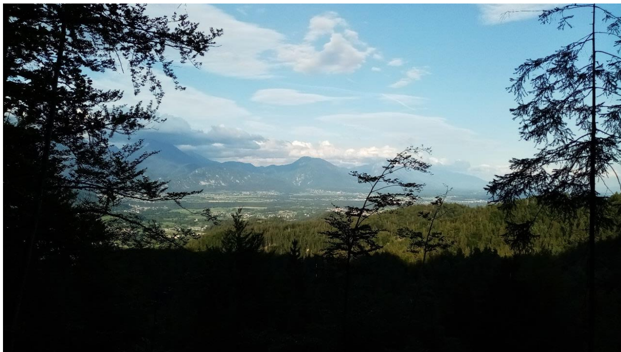
Slika 1 Razgled s Pokljuke

Eden od letošnjih izzivov pri slovenščini je bil priprava lastne potopisne reportaže. Za svojo reportažo sem izbrala počitnice v predlanskem letu. To so bil prav poseben čas, saj so to bile moje zadnje počitnice z babi, ki je na žalost umrla konec prejšnjega poletja.