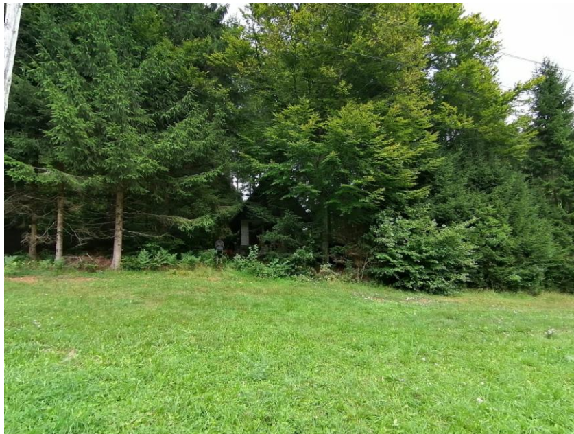
Slika 3 "Naša" hišica na Pokljuki