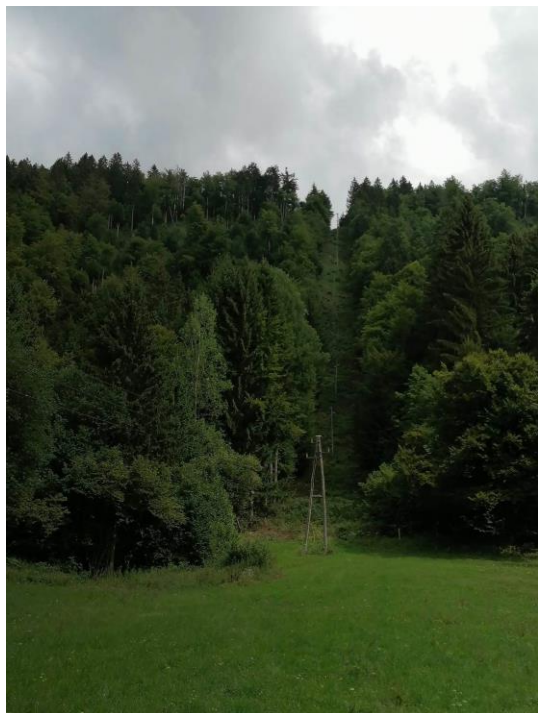
Slika 10 "Nanin" vrh

družabnih iger. Popoldne sta sosedi odšli, jaz pa med umikanjem ledenikov sem se še povzpela na hrib, ki pa sploh ni hrib, ampak le vzpetinica ob koči, na kateri stoji električna napeljava. Vzela sem majhen nahrbtnik, vanj položila ne vodo, temveč čokolado, si obula očetove pohodne čevlje, ker sem jih po nesreči zamenjala s svojimi, in se odpravila. Klanec je bil na nekaterih delih tako strm, da sem se morala oprijemati vej. Na vrhu sem najprej uživala v prekrasnem razgledu na sosednja hribovja, ki so žarela ob sončnem zahodu, potem pa poklicala babi in ji pomahala z vrha tega majhnega hribčka. Med celotnimi počitnicami sem si želela, da bi v živo videla jelena, ki je tako značilen za območje Pokljuke. Želja se mi ni uresničila, sem pa namesto tega videla več kot preveč meni neljubih živali, tj. pajkov, ki ji je bilo kot mravelj. Od babi sem kasneje izvedela, da se je s hriba vse zelo dobro slišalo in da so me lahko dve uri, torej uro mojega vzpenjanja in eno uro spuščanja, poslušali peti arije.