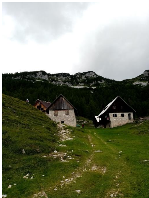
Slika 4 Blejska koč

Vsako jutro, ko smo se otroci zbudili, babi ni bilo več v postelji. Pridno in tiho smo počakali, da nas je poklicala na »fruštek«; če pa smo se že začeli pripraviti, smo to počeli šepetaje, da je babi imela svoj jutranji mir.