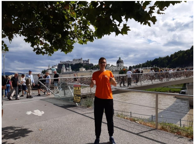
Slika 9: Avtor s panoramo mesta v ozadju

S svojo zapuščino je mesto res privlačno očem turista, ki v njem lahko ure in ure občuduje čudovite zgradbe in bogato ter zanimivo zgodovino, ki se skriva za njimi. V tej reportaži sem hotel čim bolj zajeti trenutni utrip mesta, zato sem se osredotočil na stvari, dogodke in dejstva, ki so po mojem mnenju najbolj pripomogli k temu.