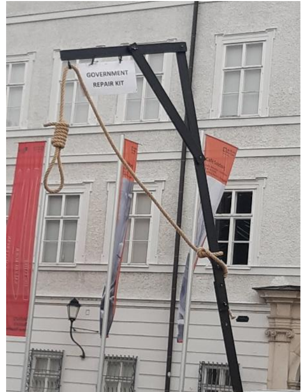
Slika 4: Protestniški rekvizit

V središču mesta, v t. i. »Altstadtu«, kjer se nahajajo vse pomembnejše stavbe od raznih cerkva pa do mestne hiše, je vladalo »izredno stanje«. Veliko ljudi se je gnetlo po trgih in majhnih mestnih uličicah. Na ploščadi ob koncertni dvorani se je dogajal tudi manjši protest, ki je pogost pojav v velikih mestih. S transparentov sem razbral, da ljudje protestirajo proti avstrijski politiki na splošno, saj naj bi se po njihovem mnenju pozornost politikov po njihovem mnenju prehitro in v preveliki meri preusmerila iz pandemije na vojno v Ukrajini. Po celotnem mestnem središču je bilo zato prisotnih veliko medijev in policijskih enot. To vzbudi mojo radovednost, zato previdno pristopim do bližnjega policista in ga v polomljeni nemščini vprašam: »Entschuldigung, was passiert hier?« (»Oprostite, kaj se tu dogaja?«). Z globokim glasom mi odgovori: »Den Präsident des Österreichs kommt, denn es ist die Eröffnung des Salzburger Festspiele« (»Ob odprtju salzburškega festivala bo mesto obiskal avstrijski predsednik.«). Policistu se za dane informacije zahvalim.