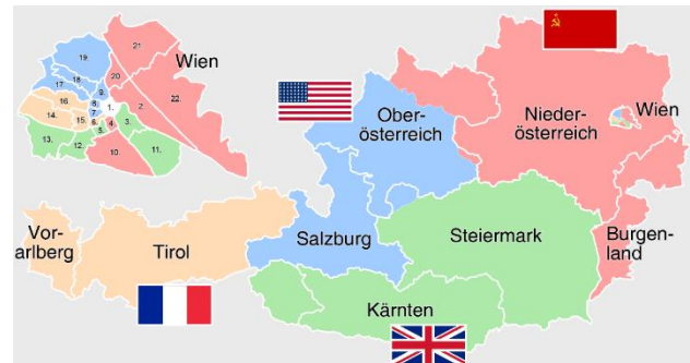
Slika 2: Okupacijske cone po 2. svetovni vojni

cesarstvo kot Nadškofija Salzburg. Med Napoleonovimi vojnami je mesto najprej prišlo v toskanske roke, nato v avstrijske, zatem pod oblast Kraljevine Bavarske, po koncu Napoleonovih vojn pa je dokončno prešlo pod oblast Kraljevine Avstrije. Nato je bilo vključeno v različne državne tvorbe pod avstrijsko oblastjo, leta 1938 pa so oblast prevzeli Nemci. Med 2. svetovno vojno mesto ni bilo hudo poškodovano, zato je še vedno moč videti ohranjeno baročno arhitekturo. Ameriške čete so v mesto vstopile 5. 5. 1945. Po vojni je bilo mesto del ameriškega okupacijskega območja do leta 1955, ko so se avstrijske pokrajine spet združile v enotno državno tvorbo, ki obstaja še danes. To je Republika Avstrija.