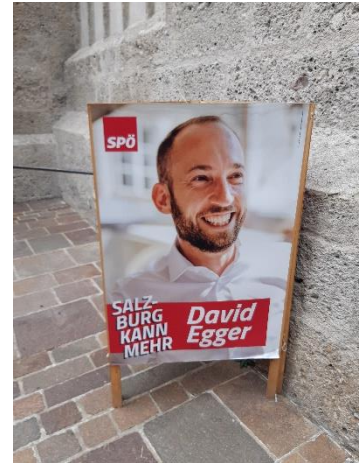
Slika 8: Obraz lokalne politike

Volivci v avstrijskih zveznih deželah volijo poslance v deželni parlament. Nazadnje so ob tej priložnosti odšli na volišča leta 2018. 36 poslancev je izvoljenih za dobo petih let. Trenutno ima s 15 sedeži večino v parlamentu poslanska skupina stranke ÖVP (Avstrijska ljudska stranka). ÖVP vodi tudi zvezno vlado skupaj z Zelenimi in NEOS (Novoavstrijska liberalna stranka salzburški župan Wilfried Haslauer, ki prihaja iz vrst ÖVP.