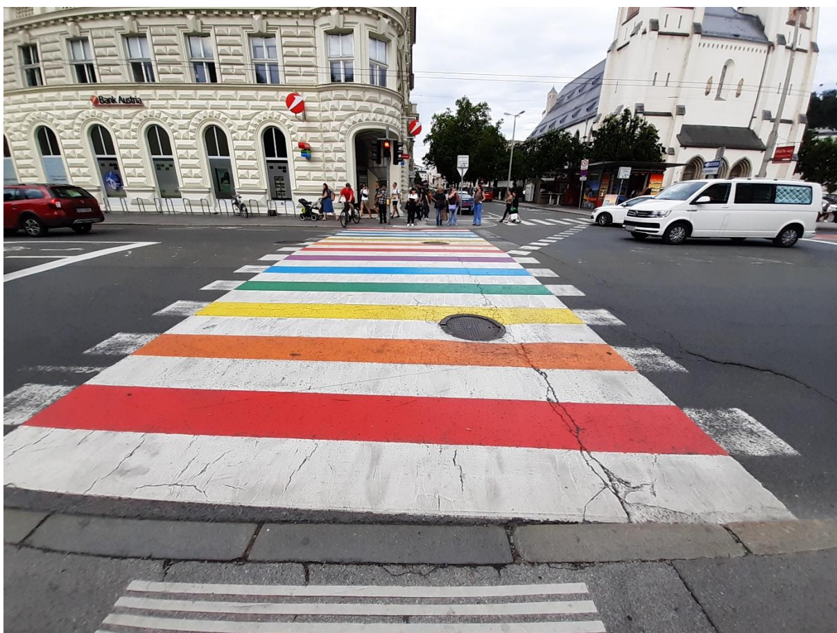
Slika 1: Utrinek iz mesta

Verjetno je že vsakdo slišal za Salzburg. To je mesto na severozahodu Avstrije, blizu meje z Nemčijo, na jugu pa meji na Alpe. Ime mesta se dobesedno prevede v »Slani grad« (Salz = sol, Burg = grad). Mesto je ime dobilo zaradi nahajališč soli v bližini in pa zato, ker so včasih po reki Salzach (Salz + Aach; Aach izvira iz starogermanske besede za vodo – ahwō), ki teče skozi Salzburg, prevažali sol. S približno 160.000 prebivalci je tudi 4. največje mesto v Avstriji in prestolnica istoimenske avstrijske zvezne dežele Salzburg (Solnograška). Slovi po svoji bogati kulturnozgodovinski zapaščini, s katero privabi na milijone turistov letno. Usoda mi