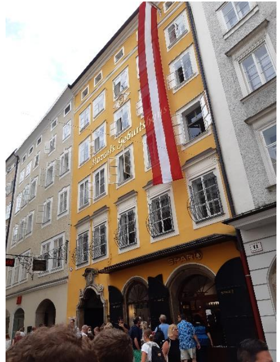
Slika 6: Mozartova rojstna hiša na Getreidegasse

Ob odkrivanju mestnih znamenitosti se podamo na sprehod po Getreidegasse. To je nakupovalna ulica v starem delu mesta, ki s svojo zgodovino sega že v čase srednjega veka, ko bile tu hiše številnih obrtnikov in pomembnih meščanov. Ulica je posebna zaradi svoje usmerjenosti k ohranitvi izgleda, kakršnega je imela ulica v srednjeveških časih, ko se je na njej bogato trgovalo. Še posebej stopi v oči čudovito ohranjena infrastruktura nad vhodnimi vrati. Ulica je slabih 20 let nudila tudi dom enemu izmed najbolj znanih Salzburžanov, enemu izmed najznamenitejših piscev simfonij, oper in koncertov, enemu in edinemu Wolfgangu Amadeusu Mozartu, čigar rojstna hiša stoji na Getreidegasse 9. Danes je v njej urejen i Wolfgangova lastnina (glasbila, pisma itd.), preko katere spoznamo glasbenega genija.