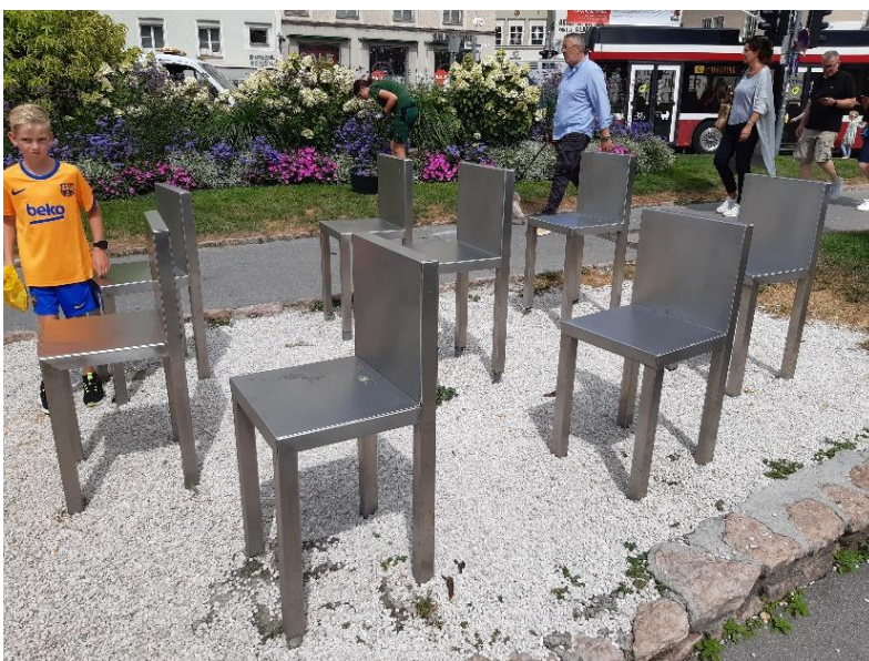
Slika 3: Inštalacija Marine Abramović

Po nekajurnem potovanju avtocesto zapustimo nekje na salzburški obvoznici. Uspešnemu lovu na parkirno mesto je v soparnem Salzburgu sledila napotitev k umetniškimi inštalacijam svetovno znane konceptualne in performans umetnice srbskega rodu Marine Abramović. Tam smo se namreč zbrali udeleženci turističnega ogleda, katerega vodič nam je v naslednjih dveh urah razkazal mesto. Stoli na