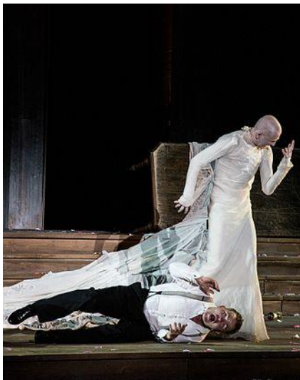
Slika 5: Igra Jedermann

Salzburški festival je zelo znan 5-tedenski festival opere, dramske igre in koncertov. V tem času se center Salzburga spremeni v prostor nenehnega kulturnega dogajanja. Takrat lahko obiskovalec spremlja koncerte, na katerih igrajo Mozartova dela, klasične drame izpod peres znamenitih piscev, zabava pa se lahko tudi ob sodobni elektronski glasbi (v manjši meri). Vrhunec festivala pa je igra Jedermann, katere avtor je Hugo von Hofmannsthal. Glavna tematika igre je neizogibnost smrti. Igra je