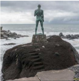
Slika 2 Kip Nuna Mendanha