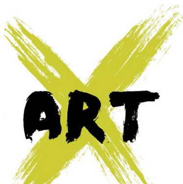
Slika 9 Art X logo

Pripombe dodal [P1]: Vmes? Med čim? Potekom festivala?