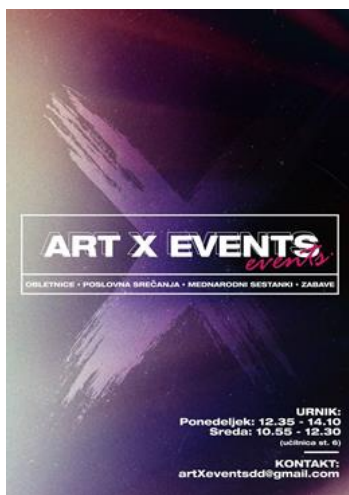
Slika 1 Plakat Art X Events

Letošnja tema 17. mednarodnega festivala Več znanja za več turizma je »Festival naj bo«. Ker smo v letošnjem letu dijaki 3. letnika smeri aranžerski tehnik odprli dijaško podjetje Xevents d. d., ki se ukvarja z organizacijo dogodkov, smo se odločili, da bomo sodelovali na tekmovanju Več znanja za več turizma in organizirali Festival ART X. Festival ART X bo trajal 3 dni in se bo odvijal na različnih slikovitih lokacijah v Sežani in okolici. Namen festivala je združevanje kreativnih ljudi. Ciljna publika so ljubitelji umetnosti, bivši dijaki programa aranžerski tehnik in širša javnost. Festival ART X bo eden največjih festivalov umetnosti na Krasu in v primorski regiji. Potekal bo v spomladanskem času na kulturnih lokacijah v Sežani in njeni okolici, v organizaciji podjetja ART Xevents. Namen festivala je privabiti čim več domačih in tujih umetnikov ter spodbuditi mlade v kreativnem izražanju, učenju in spoznavanju umetnosti ter sklepanju novih vezi med umetniki.