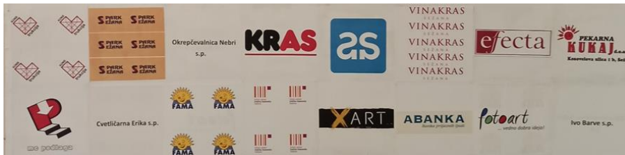
Slika 10 Sponzorji