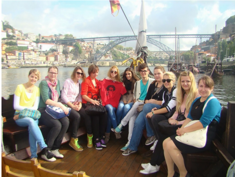
Mednarodna izmenjava v Portu na Portugalskem

Poleg omenjenih strokovnih potovanj dijaki prvih letnikov vseh programov drugi teden v septembru preživijo na športnem tednu v Portorožu , kjer se ob različnih športnih aktivnosti družijo s sošolci in profesorji, se med seboj spoznavajo in tako lažje prebrodijo morebitno stisko ob prehodu v novo šolo. Športni teden z aranžerji in ekonomci nato ponovimo še v drugem letniku, kjer se odpravimo v Mladinski center v Dolenjskih toplicah . Tam se dijaki ukvarjajo predvsem s pohodništvom, kolesarstvom, plavanjem, lokostrelstvom, skupinskimi športnimi igrami in se seveda družijo. Vedno pa skrbno pazimo, da dijaki in seveda njihovi starši z izmenjavami in športnimi tedni nimajo visokih stroškov.