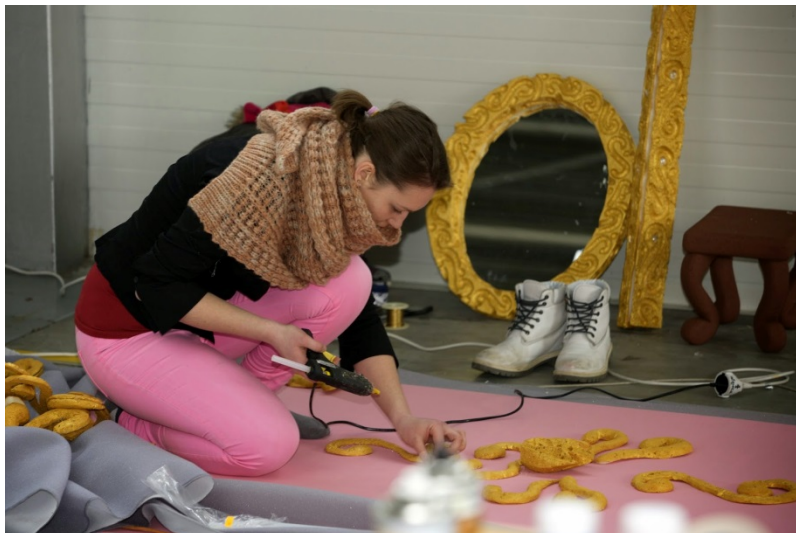
Državno aranžersko tekmovanje

Ker je aranžerski poklic usmerjen v okolje in je segment dela posameznih podjetij, uspešnega aranžerja odlikuje tudi komunikativnost, sposobnost timskega dela, samoiniciativnost, podjetnost, odprtost in želja po kosoanju z vedno novimi izzivi. Dijaki, ki se vsaj delno najdejo v opisu, se na naši šoli praviloma dobro počutijo, saj je način dela in kreativen pristop pisan na kožo prav njim.