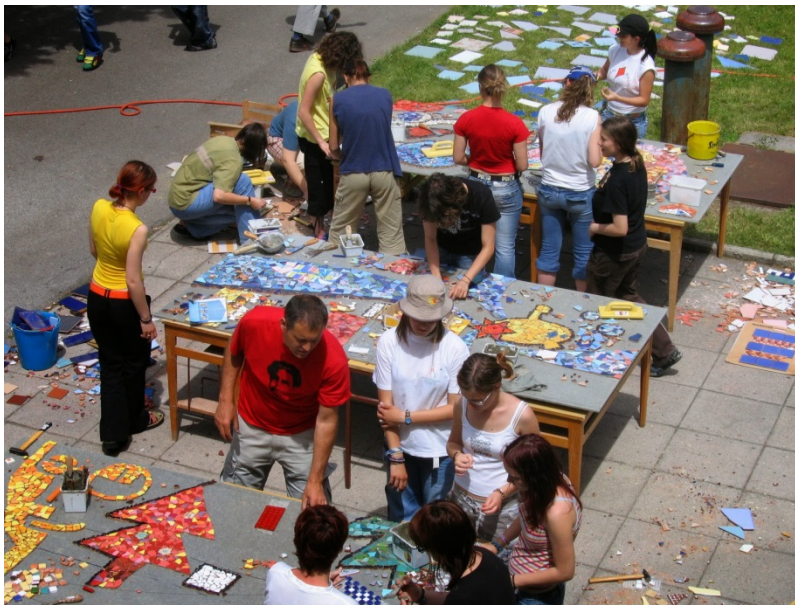
Izdelava mozaika za fasado šole

V programu aranžerski tehnik so potrebe gospodarstva prisotne predvsem v strokovnem modulu vezanem na multimedijo, ki sledi sodobnim trendom in vsebuje znanja računalniškega oblikovanja, 3D modeliranja, videa, animacije, fotografije in še veliko več . S tem modulom in ostalimi strokovnimi predmeti aranžerski tehniki šolani pri nas prestopijo meje stereotipa o aranžerjih, ki urejajo izložbe in zavijajo darila, saj med štiriletnim šolanjem pridobijo znanja obvladovanja sodobnih izraznih sredstev, ki danes dominirajo trgu.